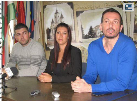
Саветовалиште ради бесплатно

Саветовалиште ради бесплатно одговорности за оне који својим (не)свесним потезима стварају проблеме, свеједно, нaručiocима или понуђачима. Одговор на питање зашто је то тако остаје непознат, и све док је тако, корупција цвeта. Транспарентност Србија је нестраначка и непрофитна организација већ десет година посвећена борби против корупције.