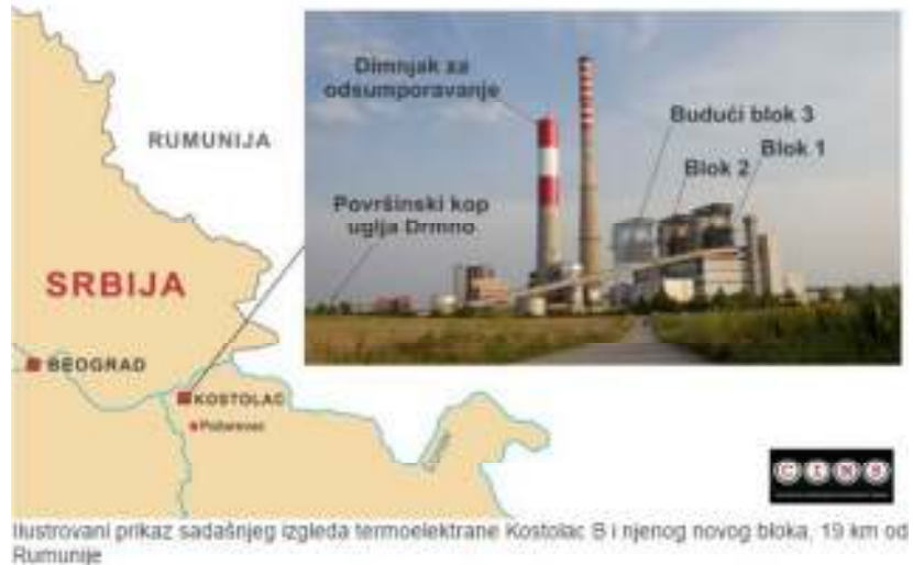
Ilustrovani prikaz sadašnjeg izgleda termoelektrane Kostolac B i njenog novog bloka, 19 km od Rumunije

Bušatlija objašnjava da su uslovi na koje je Srbija pristala neophodni kako bi uzimala velike zajmove: „Vi zalažete budžete jer ne možete drugačije da dobijete kredit (...) Mi smo zemlja koja donosi veliki rizik u poslovanju. Pripadamo kategoriji čiji dug mora da se otrese lako ukoliko dođe do toga (do problema)“.