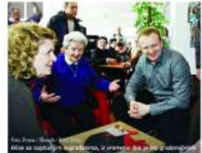
Foto: Bivši gradonačelnik Beograda Dragan Đilas sa vaspitačima i penzionerima, u vreme kada je bio gradonačelnik.

Bivši gradonačelnik Beograda Dragan Đilas plaćen je kaznom od 60.000 dinara jer je 2016. isplaćivao penzije i vaspitačima penzionerima i pomoć plate vaspitačima.