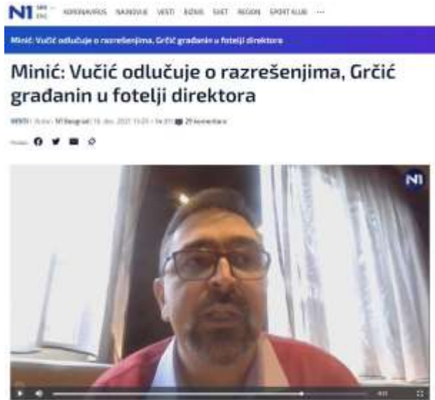
Predsednik Srbije Aleksandar Vučić pokazao je da upravlja time ko će biti razrešen u javnim preduzećima, kaže Zlatko Minić iz Transparentnosti Srbije, dodajući da Milorad Grčić po zakonu od 2017. godine nije direktor EPS-a.

“Ovde je problem jednostavno u nepostojanju pravne države”, kaže on. Na izjavu premijerke Ane Brnabić da službe bezbednosti treba da provere šta je rađeno u EPS-u, Minić govori da ga to podseća na frazu “pustite nadležne da rade svoj posao”. Kako kaže, minulih godina su Transparentnost i Fiskalni savet i brojni stručnjaci upozoravali šta će se desiti u EPS-u zbog ovakvog rukovođenja. Dodaje da se u EPS-u odustajalo od investicija kako bi se veštački prikazalo da je u plusu i da bi se ta sredstva uplaćivala u budžet, kako bi budžet bio u suficitu.